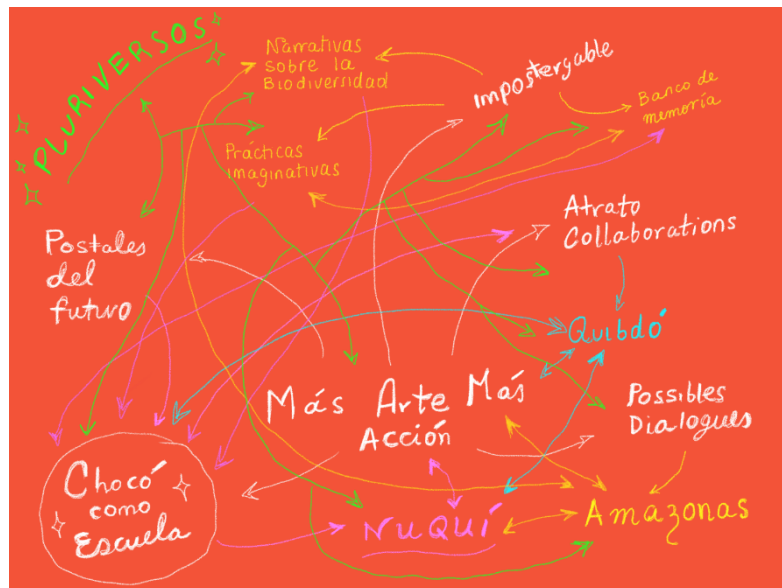
Figura 01: Más Arte Más Acción

acumulación utilizado en las zonas rurales de Indonesia, donde las cosechas producidas por una comunidad se almacenan como un recurso futuro común, que luego se distribuye a través de la gobernanza colectiva. Lumbung como premisa para hacer de la exposición y sus procesos un contenedor de recursos colectivos que funciona bajo la lógica de lo que podría llamarse el procomún; es una aglomeración de ideas, historias, labor, tiempo y otros recursos compartibles.