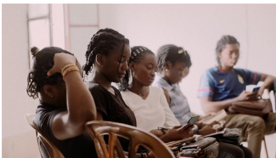
Figura 04: fotograma “Marlene” (2022)

aprendizaje radical en espacios públicos. Entendiendo el arte como forma de producción de conocimiento y la educación como una práctica artística en sí misma. En este sentido el proyecto busca acercar el arte y la educación a las realidades sociales de lugares específicos, asociándose con universidades, instituciones y comunidades para la creación de proyectos formativos en Latinoamérica. Siendo así, en las palabras de Braceli, el proyecto tiene sus raíces en una larga genealogía de educadores y artistas latinoamericanxs, cuya obra se ha vinculado activamente con contextos tangibles, para aprender y actuar sobre ellos. Mediante un aprendizaje público, se propone un programa transdisciplinario donde diversas formas de prácticas coinciden en la capacidad transformadora de la educación. Una muestra de ello es el espacio de conversaciones donde, por ejemplo, el artista venezolano Luis Romero dialogó con el artista yanomami Sheroanawe Hakihiiwe 7 a partir de la premisa del término wēai : (enseñar a través del ejemplo), sobre los conocimientos ancestrales de la cultura y pueblo Yanomami y sus formas particulares de ser transmitidos.