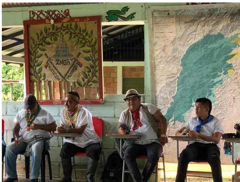
Figura 02: Devenir Universidad